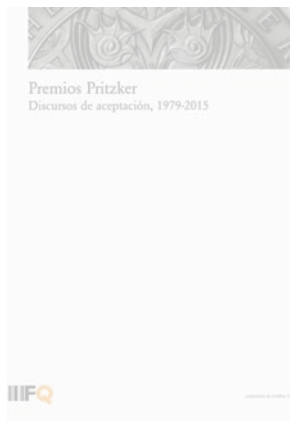
PREMIOS PRITZKER Discursos de aceptación, 1979-2015 Varios autores Fundación Arquia, 2015 Texto en español/287 págs.