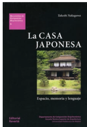
LA CASA JAPONESA Espacio, memoria y lenguaje Takeshi Nakagawa Editorial Reverté, 2016 Texto en español/311 págs.

En este libro se analizan en detalle estas obras, con planos inéditos y material fotográfico sobresaliente.