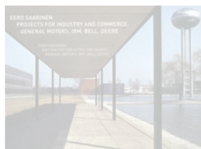
EERO SAARINEN. PROJECTS FOR INDUSTRY AND COMMERCE: General Motors, IBM, Bell, Deere Hort E. and Ingelore K. Ehlers antaeuspublishers, 2015 Texto en inglés/144 págs.

Este libro compila por primera vez, y traducidos al español, los discursos de aceptación de todos los arquitectos premiados, desde 1979 hasta el 2015, precedidos de las comunicaciones del jurado. El discurso de agradecimiento puede parecer un género menor, pero posee la virtud del mensaje elemental y comprensible a una audiencia diversa. A la vez que las obvias y conmovedoras expresiones de gratitud, se deslizan muchas otras ideas y explicaciones sobre la arquitectura que otorgan una especial luminosidad a un momento de gran intensidad emocional.